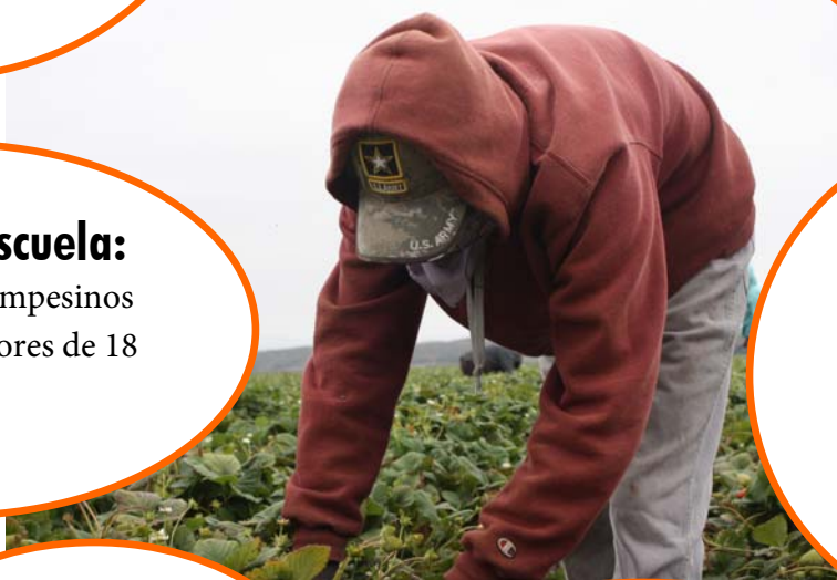
El Nivel de Educación de Campesinos